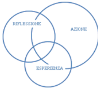
FIGURA 2 - Il Modello Ignaziano

dell'uomo. Si tratta di un modello che può offrire una risposta più che adeguata alle domande critiche sull'educazione che oggi si incontrano e ha in se stesso la possibilità di andare al di là di una pura teoria per diventare uno strumento concreto ed efficace.