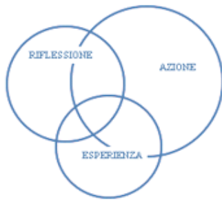
FIGURA 2 - Il Modello Ignaziano

dell'uomo. Si tratta di un modello che può offrire una risposta più che adeguata alle domande critiche sull'educazione che oggi si incontrano e ha in se stesso la possibilità di andare al di là di una pura teoria per diventare uno strumento concreto ed efficace.